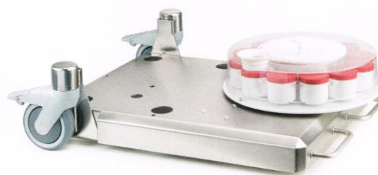
サンプルコレクター

本機種以外に、錠剤厚さも同時に測定できるタイプとして CIW6.3も揃えております。