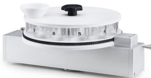
サンプルフィーダー

本機種以外に、錠剤厚さも同時に測定できるタイプとして CIW6.3も揃えております。